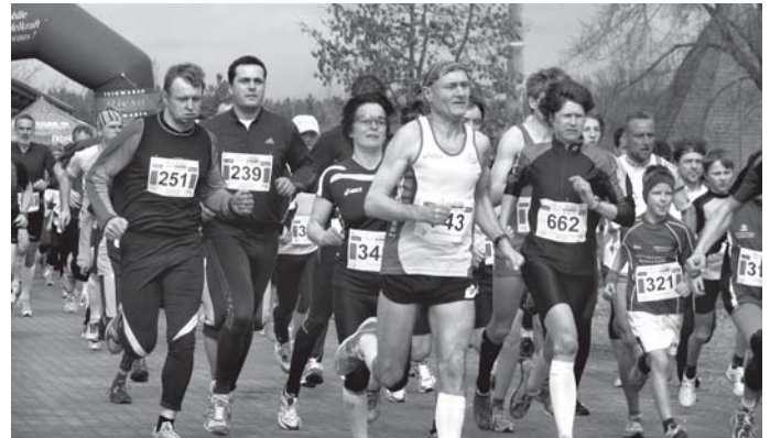
Archivfoto vom Start des Schneeglöckchenlaufes

Nunmehr zum fünften Mal veranstaltet der Lauf- u. Radfahrer Hohenbocka e.V. am 22. und 23. März den Schneeglöckchenlauf in Ortrand. Tausende Freizeitsportler aus Nah und Fern werden an der Pulsnitzhalle erwartet, um an den Wettkämpfen im Laufen, Wandern, Walken, Radfahren oder Skaten teilzunehmen. In diesem Jahr sind gleich 2 neue Wettbewerbe ins Zeitfahrprogramm aufgenommen worden. So wird es ein 2 km Rad-Einzelzeitfahren und einen Ergotrainer-Wettkampf geben. Anmeldungen sind unter www.schneeglocke.de möglich.