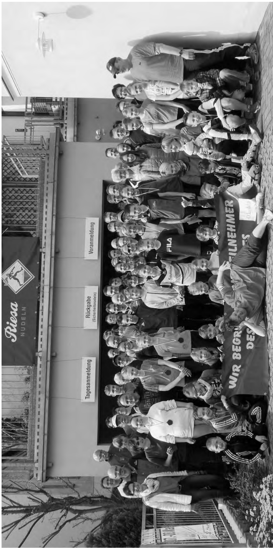
Teilnehmer des Pulsnitzaufes 2016