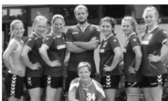
Sieger im Frauenturnier: SG Klotzsche

Im Männervergleich zwischen dem Oberligisten LHC Cottbus und dem Aufsteiger zur 3. Bundesliga HC Elbflorenz Dresden 2 wurde es ebenfalls sehr spannend. Immer wieder konnten die Lausitzer einen Rückstand aufholen und kamen bis auf Tor heran, aber im Endspurt zogen die Sachsen mit 37 : 31 davon. Es waren 2 tolle Handballspiele mit viel Kraft und Tempo und sie ließen die Handballherzen höherschlagen. Ein gelungener Abschluss des Festwochenendes.