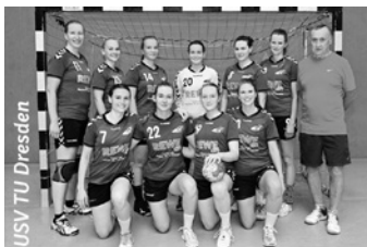
USV TU Dresden