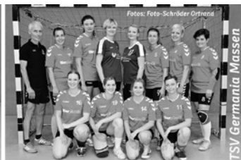
TSV Germania Massen