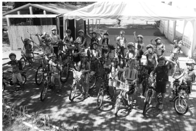
Kita „Spatzennest“ Frauendorf