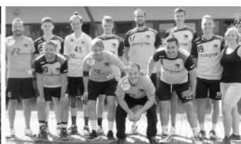
Sieger im Männerturnier: TSV 1862 Radeburg