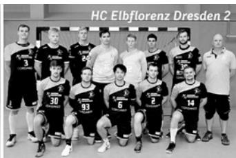
HC Elbflorenz Dresden 2