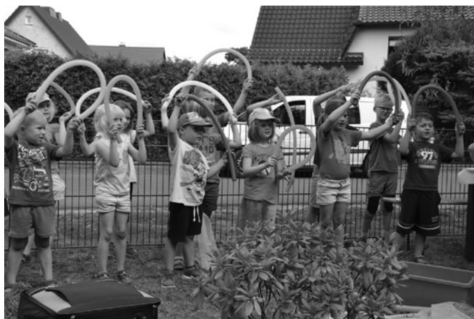
Zur Begrüßung präsentierten die Kinder der benachbarten Kita Weltentdecker ein kleines Programm.