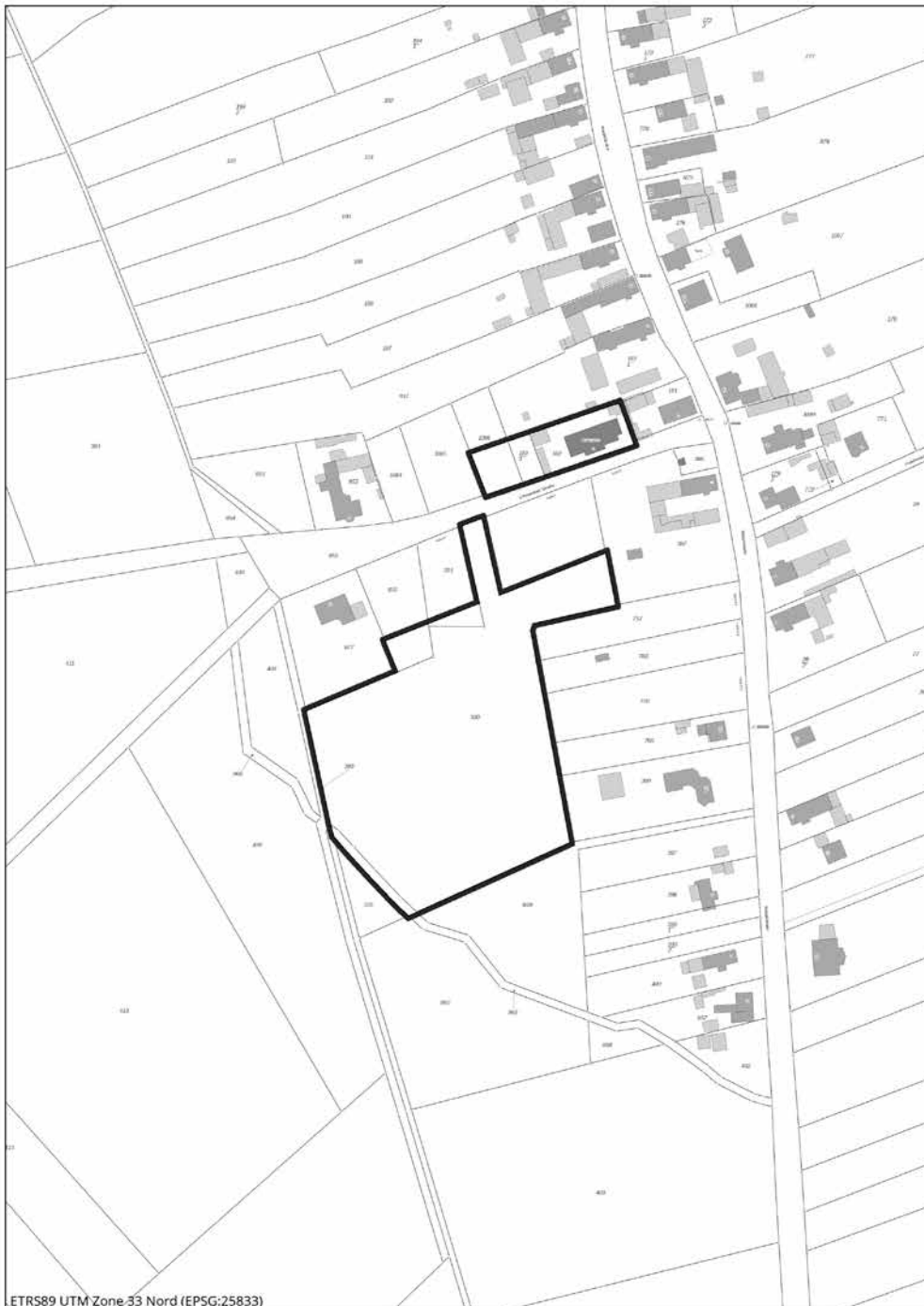
Lageplan ALK, Entwurf September 2019 M 1:2.500 (A4), Oktober 2019