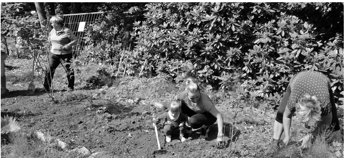
Alt und Jung im Einsatz im Rosengarten