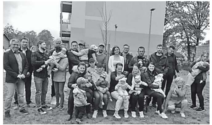
Lindenauer Nachwuchs mit Eltern, Gästen, Lindenprinzessin und den Pflanzern