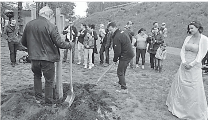
Im Beisein der Kinder und der Lindenprinzessin wurde die 23. Parkfestlinde gepflanzt.

Das Zusammentreffen der jungen Eltern mit ihrem Nachwuchs, der Häuslebauer und der Dorfbewohner an diesem Nachmittag waren eine gute Gelegenheit des Kennenlernens. Leider hat Regen und Wind das nur kurzzeitig zugelassen.