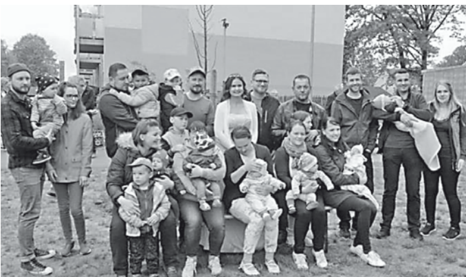
Lindenauer Nachwuchs mit Eltern und Lindenprinzessin an der neu gepflanzten Linde, die zurzeit noch nicht begrünt ist, diese kommt gerade aus dem Kühlhaus. Nur so ist das Anwachsen gesichert.